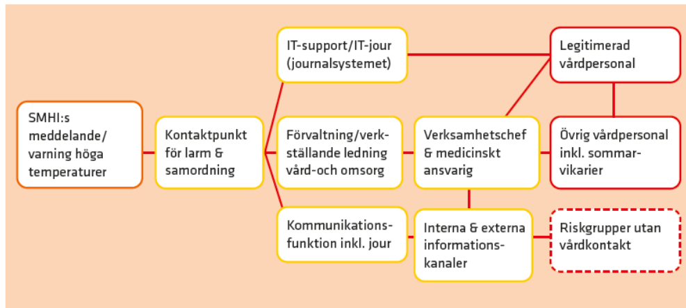
Figur 3. Schematisk översikt av tänkbara funktioner vid utformning av larmkedja, och viktiga mottagare av SMHI:s meddelande eller varning om höga temperaturer.