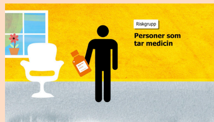
Råd vid värmeböljor – till vård- och omsorgspersonal