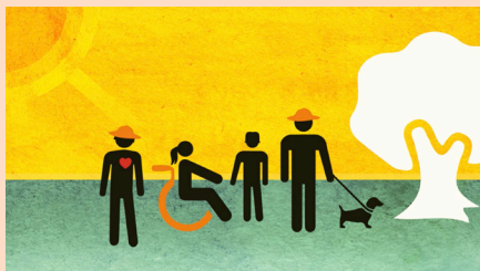
Råd vid värmeböljor – till dig, dina vänner och anhöriga